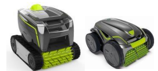
Roboter Robot GT3220/GV3420