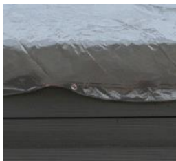
Winterabdeckung Winter cover CIKPCO66