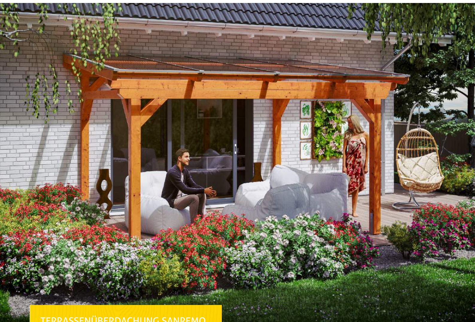
TERRASSENÜBERDACHUNG SANREMO 434 x 400 cm