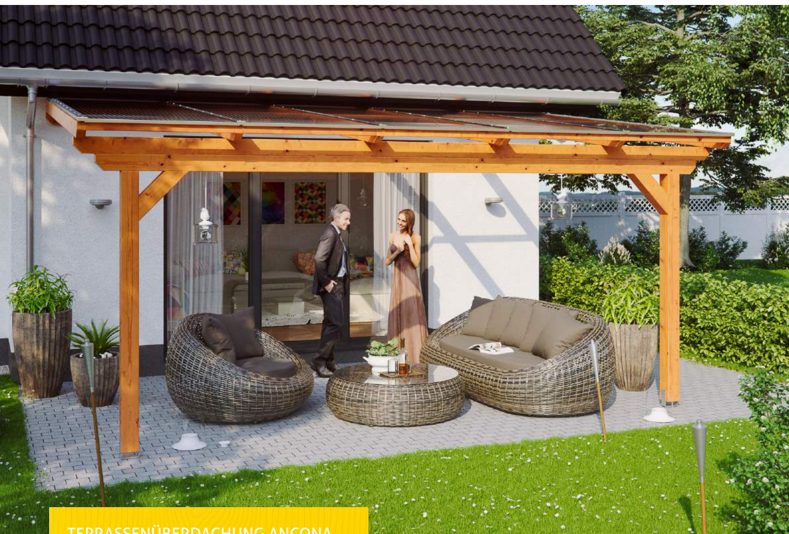
TERRASSENÜBERDACHUNG ANCONA 541 x 400 cm

Massive Konstruktion aus hochwertigem Leimholz (BSH-Fichte)