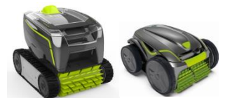
Roboter Robot GT3220/GV3420