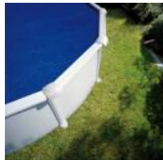
Isothermabdeckplane Isothermic cover CPROV610