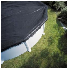
Winterabdeckung Winter cover CIPROV611