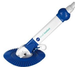
Automatischer Bodenreiniger Automatic cleaner AR20682