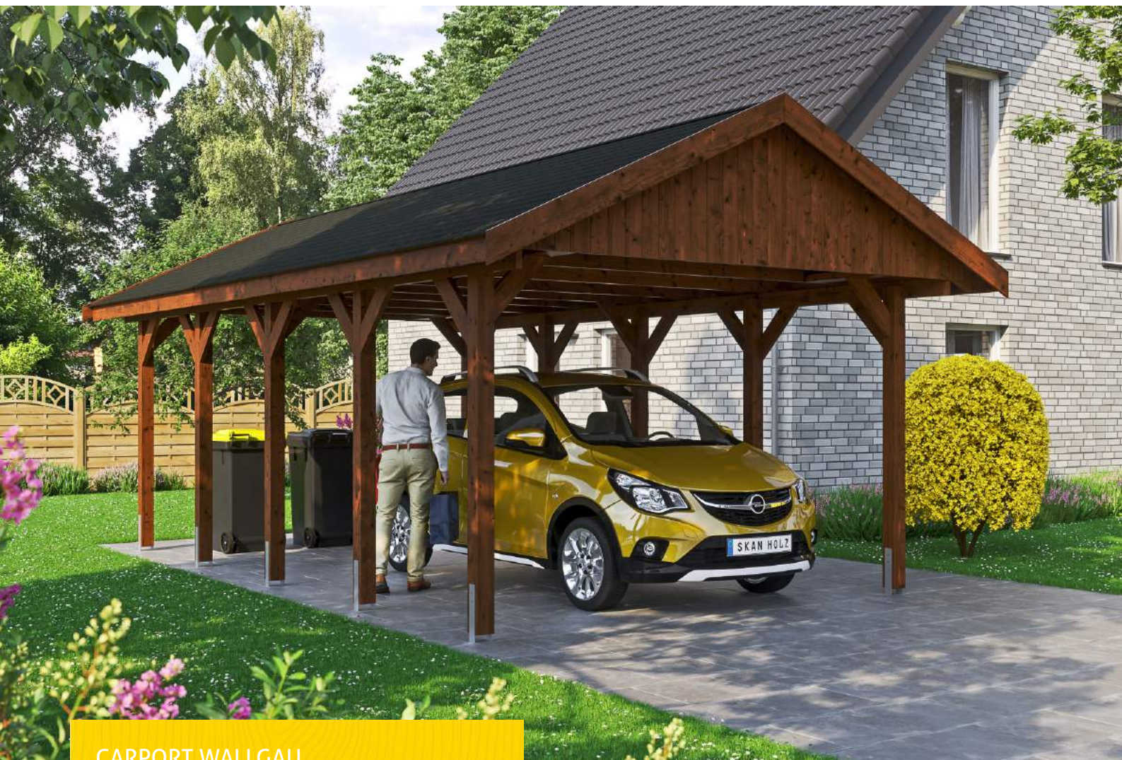
CARPORT WALLGAU 430 x 750 cm