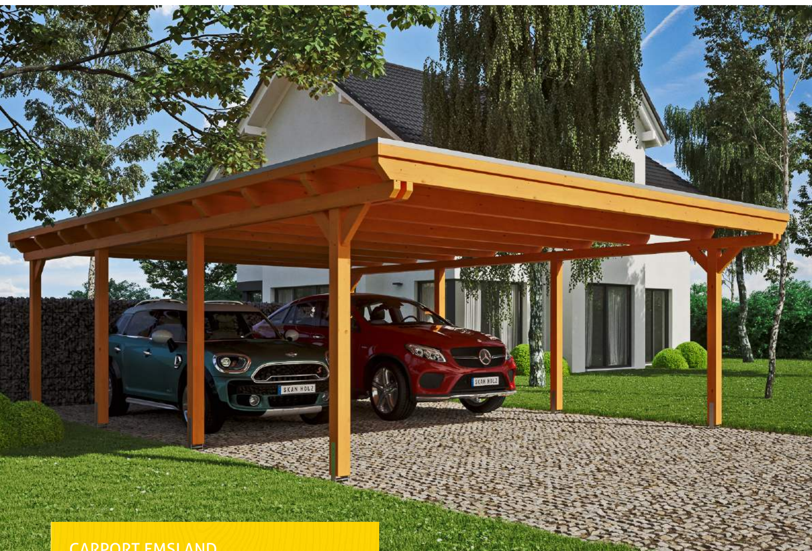
CARPORT EMSLAND 613 x 846 cm