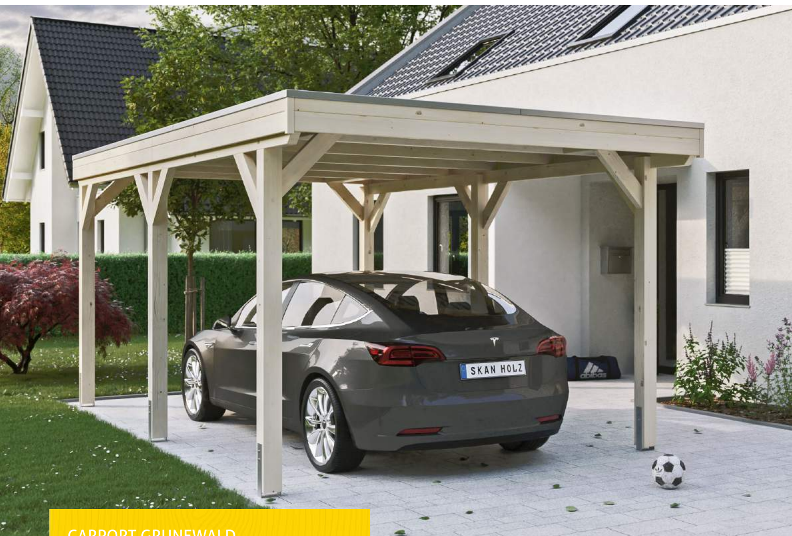
CARPORT GRUNEWALD 321 x 554 cm