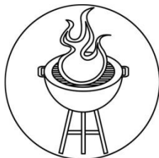
Auf einem Grill