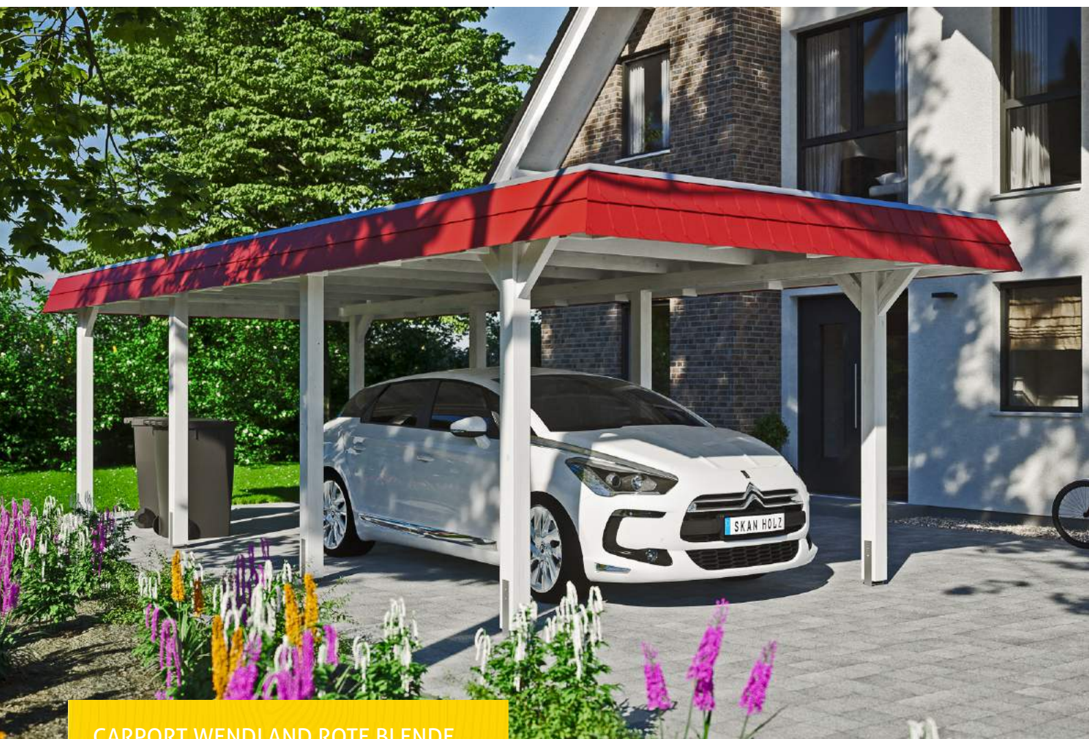
CARPORT WENDLAND ROTE BLENDE 362 x 870 cm