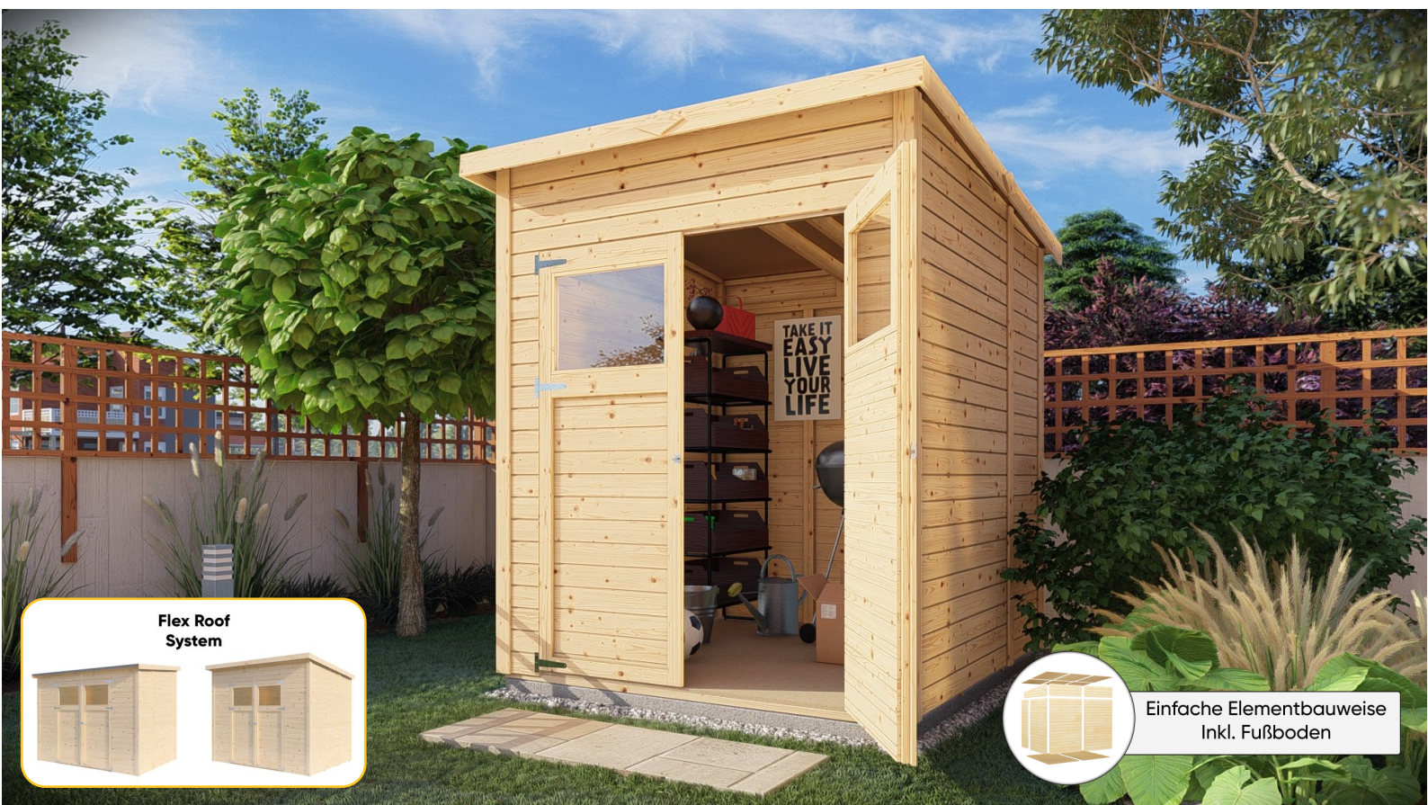
Flex Roof System