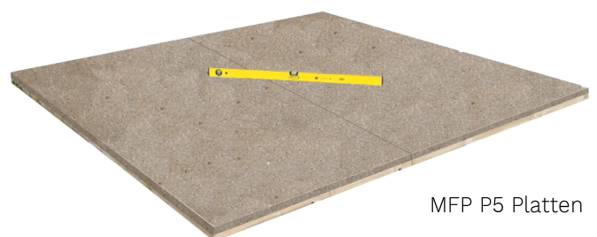
MFP P5 Platten

Fußbodenelemente* von unten behandeln, zusammenlegen, umdrehen und mit einer Wasserwaage ausrichten.