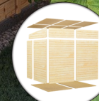
Einfache Elementbauweise Inkl. Fußboden