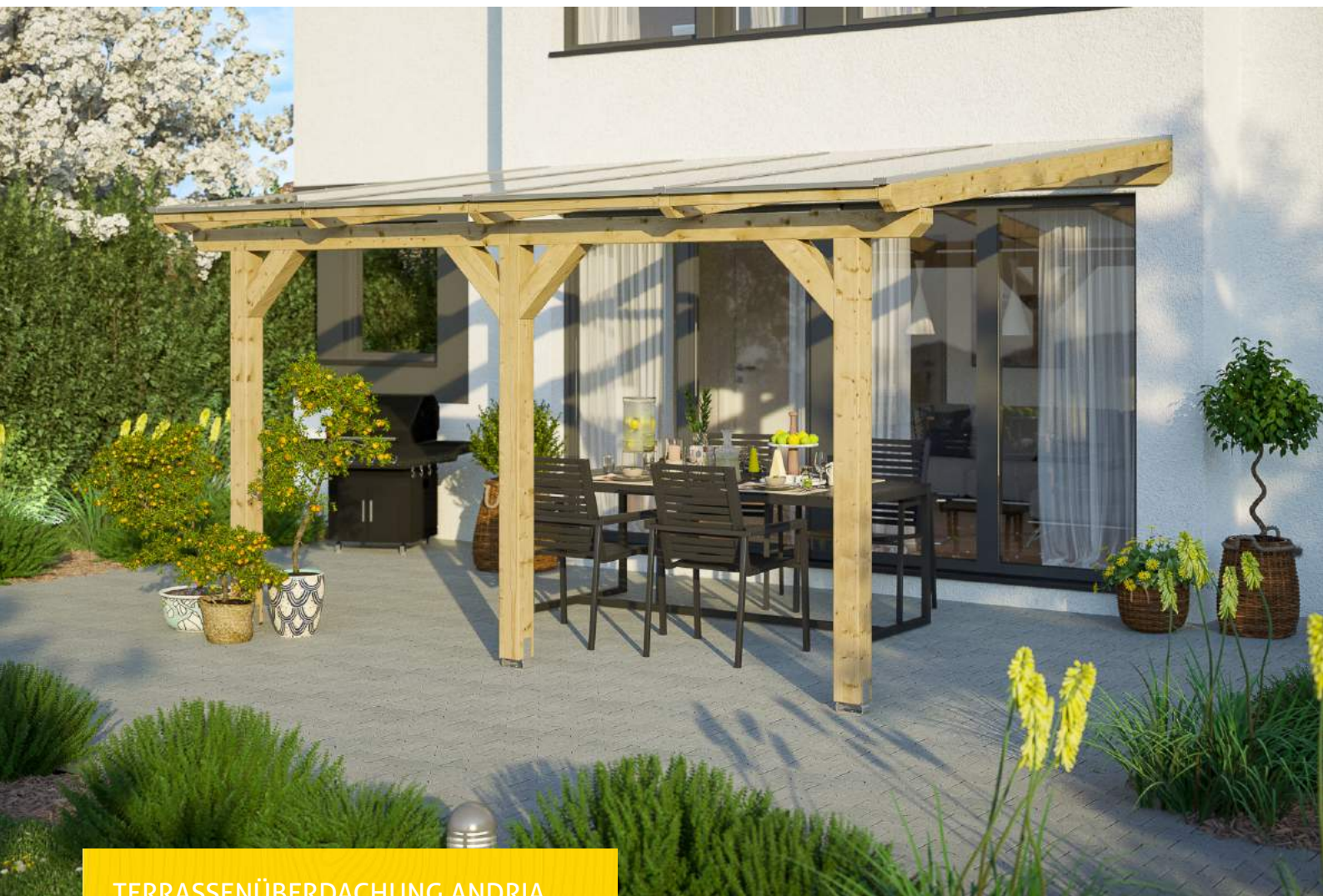
TERRASSENÜBERDACHUNG ANDRIA 434 x 250 cm

Massive Konstruktion aus hochwertigem Leimholz (BSH-Fichte)