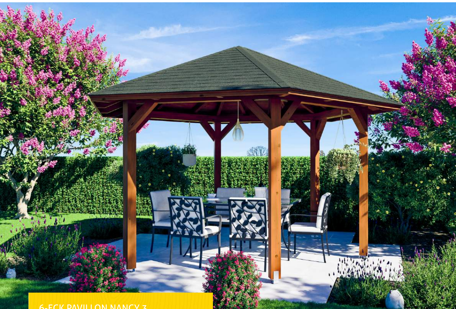
6-ECK PAVILLON NANCY 3 3 - Ø 480 cm

Massive Konstruktion aus hochwertigem Leimholz (BSH-Fichte)