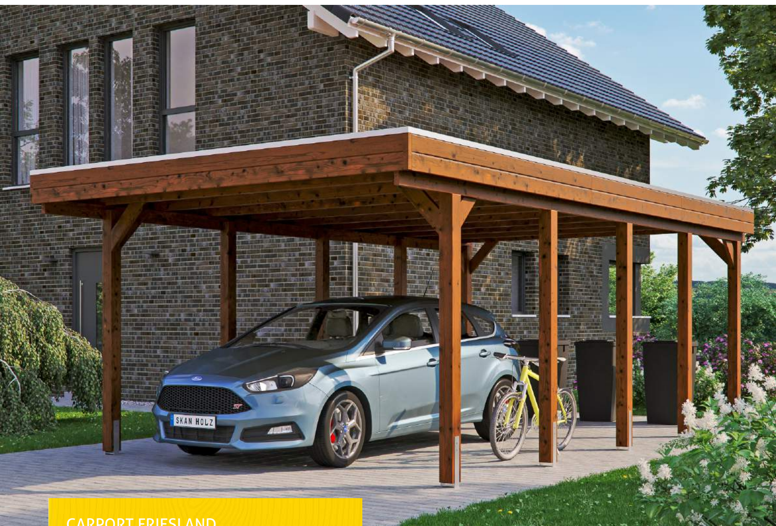
CARPORT FRIESLAND 397 x 708 cm