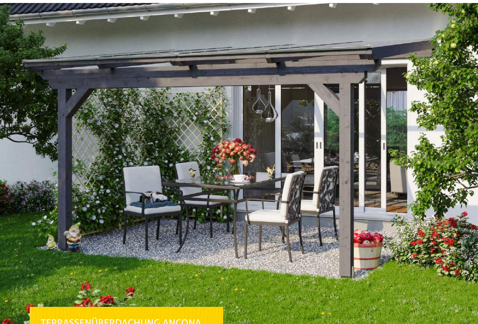
TERRASSENÜBERDACHUNG ANCONA 434 x 250 cm

Massive Konstruktion aus hochwertigem Leimholz (BSH-Fichte)