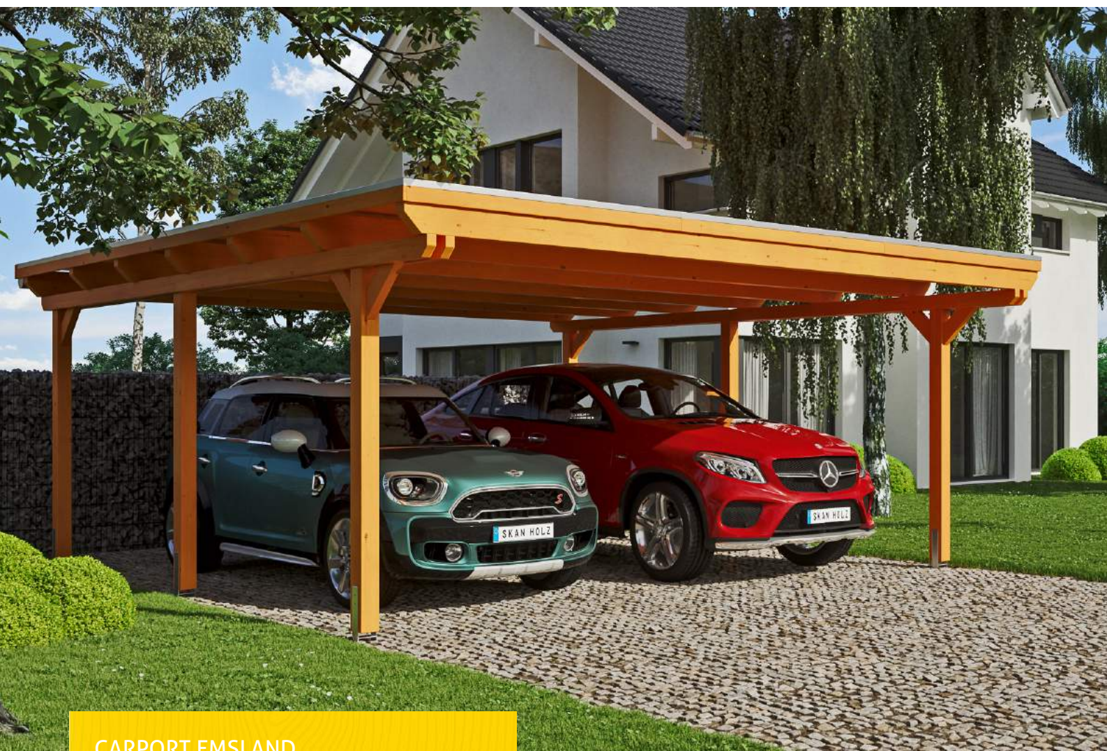
CARPORT EMSLAND 613 x 604 cm