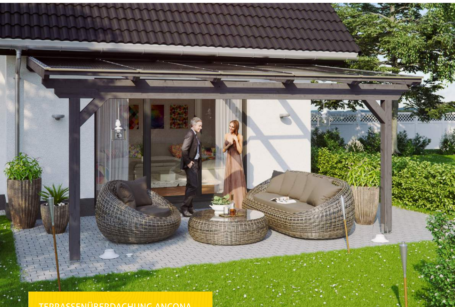
TERRASSENÜBERDACHUNG ANCONA 541 x 300 cm

Massive Konstruktion aus hochwertigem Leimholz (BSH-Fichte)